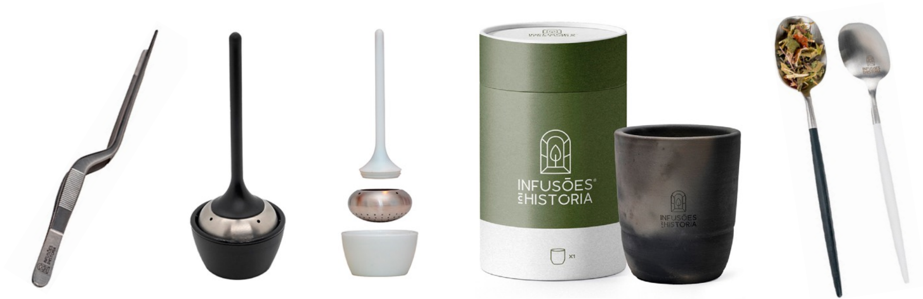
#99 - Pinça para Chá/Infusão