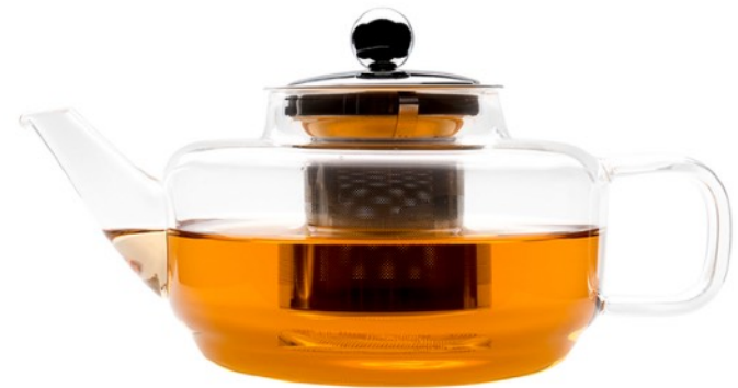
#22 - Bule em Vidro para Chá/infusão com Filtro em Inox (700ml)