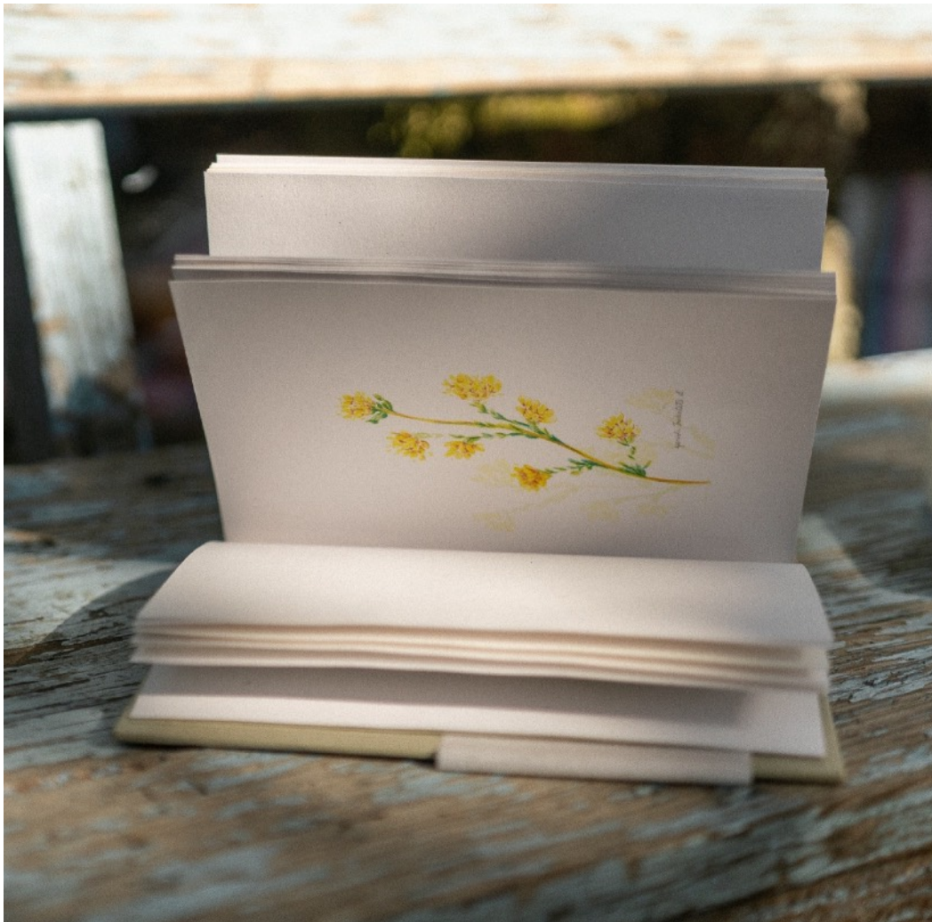
#104 - Caderno de Provas ICH