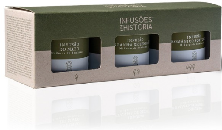
#19 - Misturas do Românico - Caixa Coffret com Três Latas Pequenas Infusão do Mato; Infusão Montanha de Sensações; Infusão Românico Português (24g)