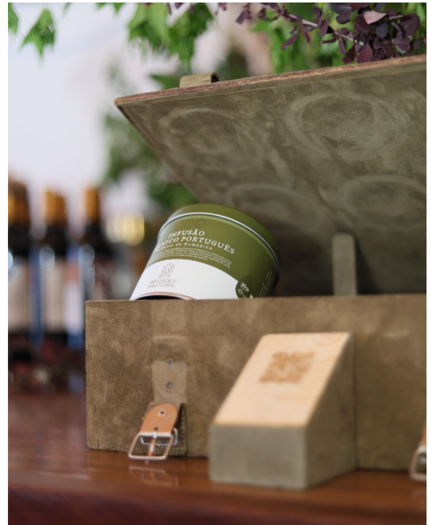
#108 - Caixa em madeira e camurça para 4, 6, 8, 9, 10 ou 12 latas grandes ICH