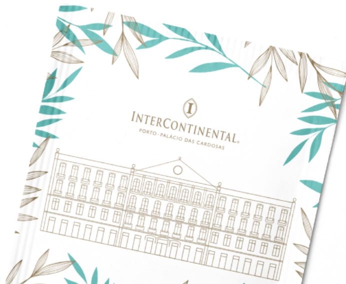
Saquetas Personalizadas ICH | Personalized Blends