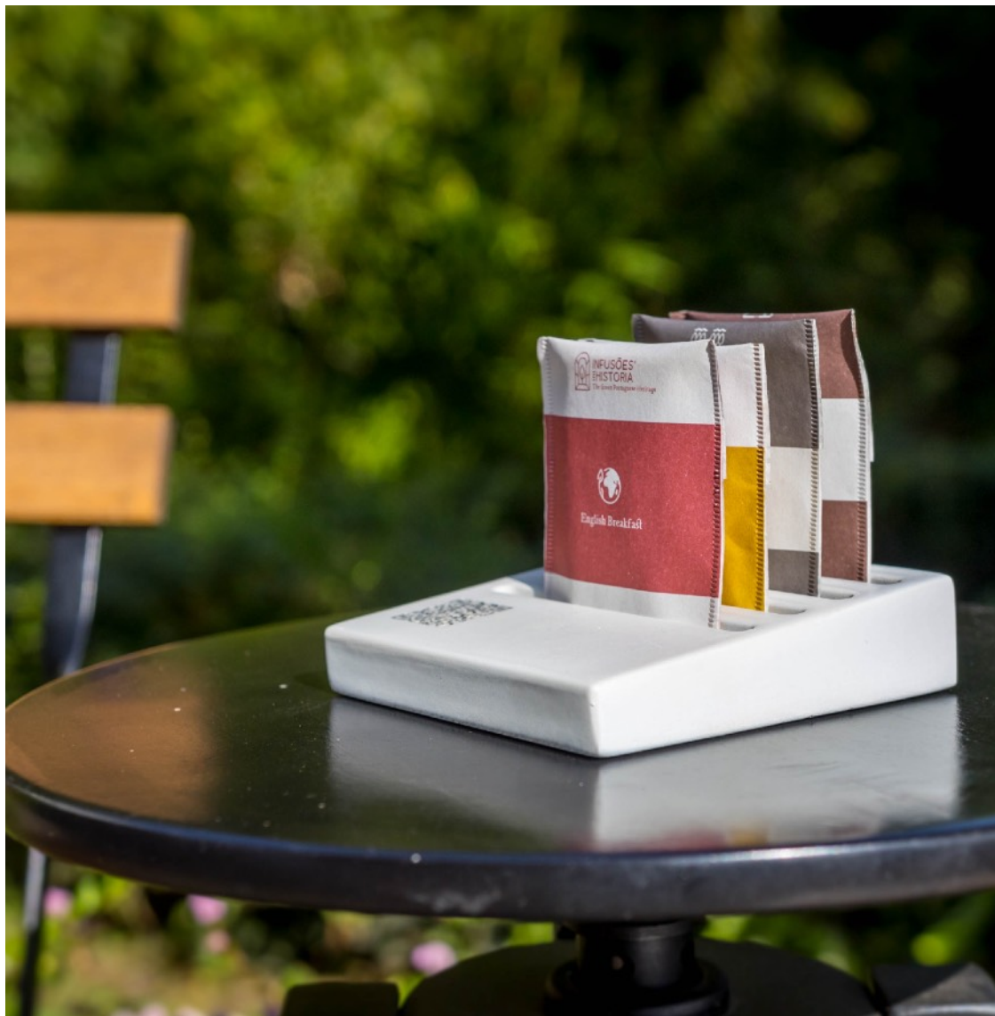
#113 - Base madeira ICH - 4 Saquetas